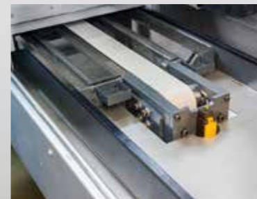
V-Flachführung in Kombination mit Zahnriemenantrieb für hohe Genauigkeit, wirtschaftlich sinnvoll bei Abdeckungen eines breiten Geschwindigkeitsspektrums