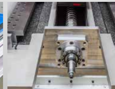
Hochtechnologie als Highendausführung, hydrostatische Systeme nahezu verschleiß- und reibungsfrei mit Positioniergenauigkeiten und Umkehrspiel im Bereich von 0,1 µm