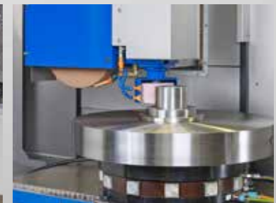
Hydrostatische Schleifspindeln und Lagerungen für höchste Rundlaufgenauigkeiten und Oberflächengüten

In Verbindung mit dem Granit bilden moderne Antriebs- und Führungstechnologien die ideale Kombination für wirtschaftliche Werkzeugmaschinen, die Maßstäbe in der Genauigkeit setzen.