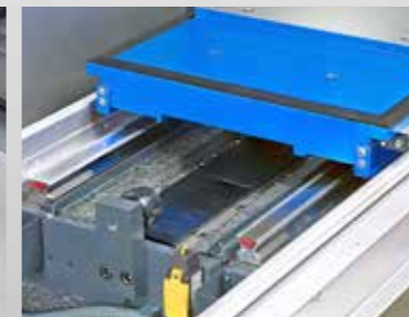
Linearführungen als Anschlusskonstruktion, hier in Verbindung mit Linearmotor für hohe Beschleunigungen und Geschwindigkeiten ebenso wie für Schleichgangoperationen